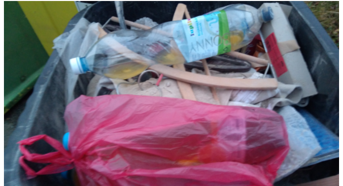
Kontejner na použité kuchyňské oleje – Krouna 2019