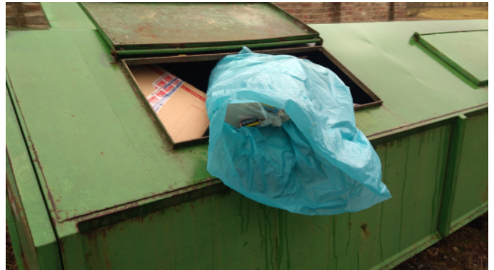
Františky 2020 – kontejner u hřbitova