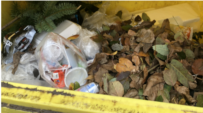
Kontejner na plasty – Oldřiš 2019