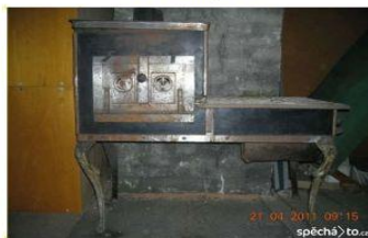
Prostory předšně rodné světničky