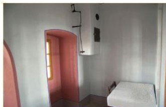
v (od podlahy ke komínu) = 145 cm, š = 144 cm, h (k oknu) = 53 cm, výklenek komín = 30 cm, v (pod oknem) = 83 cm