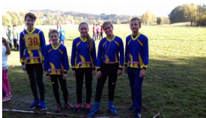
Starší žáci obsadili krásné čtvrté místo