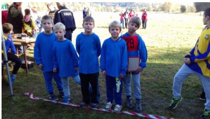
Hlídky mladších žáků celkově 14. ze 49 družstev na startu

Po roční odmlce jsme postavili i tým mladších žáků, který ve své premiéře obsadil krásné 14. místo.